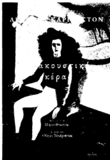
ΤΟ ΑΚΟΥΣΤΙΚΟ ΚΕΡΑΣ Λεονόρα Κάρινγκτον Εκδόσεις Αίολος

Η Μάριαν Λέδερμπι είναι 92, βαρήκοη, χορτοφάγος και γεμάτη όρεξη για ζωή. Ονειρεύεται μάλιστα ένα ταξίδι στη Λαπωνία. Όταν όμως η φίλη της Καρμέλα της δωρίζει ένα ακουστικό κέρας, Ξαναβρίσκει την ακοή της και ανακαλύπτει ότι οι δικοί της θα τη βάλουν σε γηροκομείο. Κάπως έτσι ξεκινά μία σουρεαλιστική περιπέτεια που οδήγησε πολλούς να χαρακτηρίσουν το βιβλίο «αποκρυφιστική εκδοχή της Αλίκης στη Χώρα των Θαυμάτων » - και όχι άδικα. Η Αγγλίδα Λεονόρα Κάρινγκτον (1917-2011) σχετίστηκε με τον Μαξ Ερνστ και έπαθε νευρικό κλονισμό όταν εκείνος συνελήφθη από τους ναζί. Νοσηλεύτηκε και υποβλήθηκε σε ηλεκτροσόκ στη Μαδρίτη και τη Λισαβόνα πριν το σκάσει για το Μεξικό όπου παντρεύτηκε τον Ούγγρο πολιτικό πρόσφυγα και φωτογράφο Εμέρικο «Τσίκι» Βάις. Ήταν μία από τις λίγες γυναίκες που ξεχώρισαν στους ανδροκρατούμενους καλλιτεχνικούς κύκλους εκείνων των καιρών.